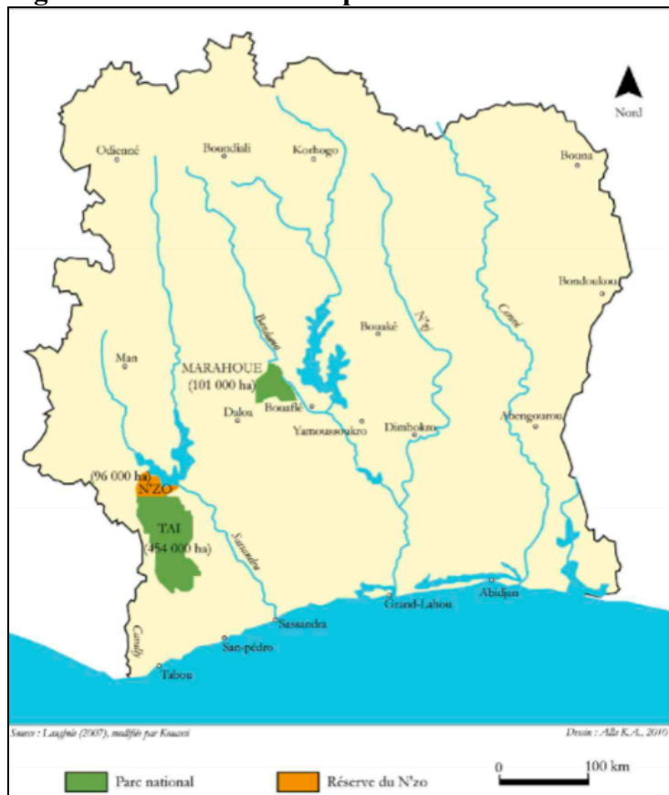
Figure 1: Localisation des parcs nationaux de Taï et de la Marahoué